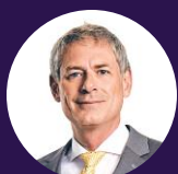
Vincent Cartier Conseils en gestion des risques

Profitez de cette conjoncture pour optimiser vos processus d'affaires. L'automatisation de certaines opérations peut améliorer votre efficacité, réduire les coûts et renforcer votre capacité d'adaptation.